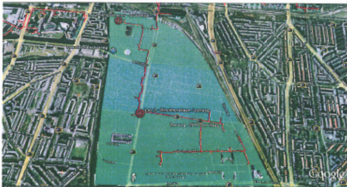
Binckhorst – Zuid & Noord