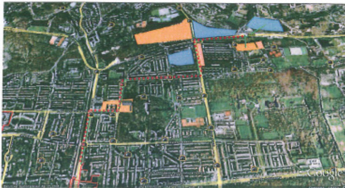
Internationale Zone – Kazernes & ICC