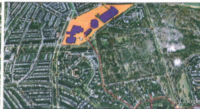
Internationale Zone – World Forumgebied